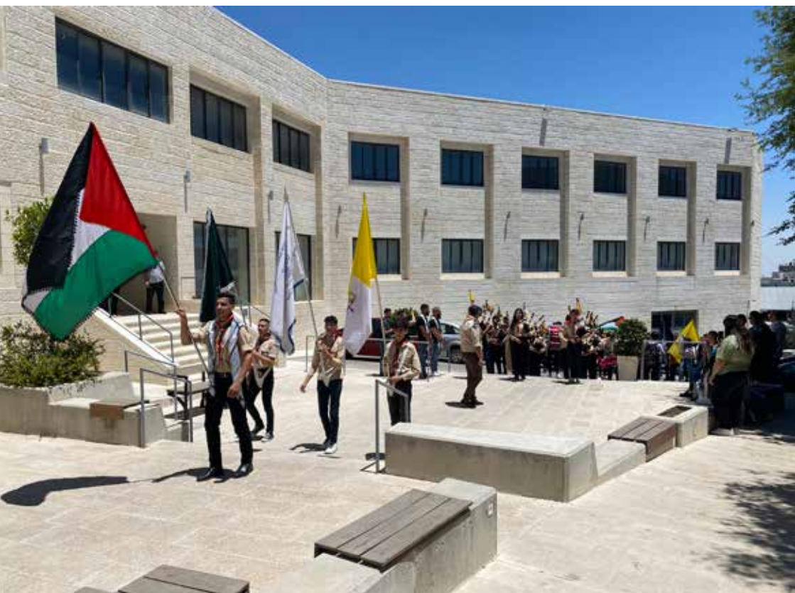
Det nyöppnade konstuniversitet i Betlehem