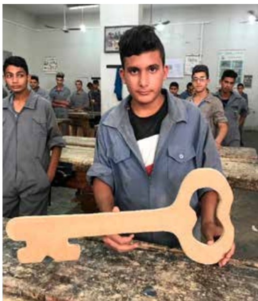
Pojke med den symboliska nyckeln på DSPRs yrkesskola i Gaza

Ett annat väletablerat partnersamarbete är med organisationen Department for Service to Palestinian Refugees (DSPR), en ekumenisk organisation som sedan slutet av 1940-talet arbetar med palestinska flyktingar i Mellanöstern. DSPR:s vision är att de palestinska flyktingarna ska få rätt att återvända till sina hem samt ett pluralistiskt palestinskt samhälle som garanterar lika rättigheter för alla. DSPR arbetar genom fem lokalkontor i länder i regionen där verksamheten bland annat består av yrkesskolor, sjukvård, psykosocialt stöd i flyktingläger och inter-religiös dialog. Ett av de lokalkontoren finns i Gaza, där DSPR bedriver yrkesskola för unga flickor och pojkar. Bland annat så finns där utbildning i metallarbete, snickeri och grafisk design. DSPR driver också lokala kliniker runt om i Gaza där vård ges till utsatta människor i marginaliserade områden.