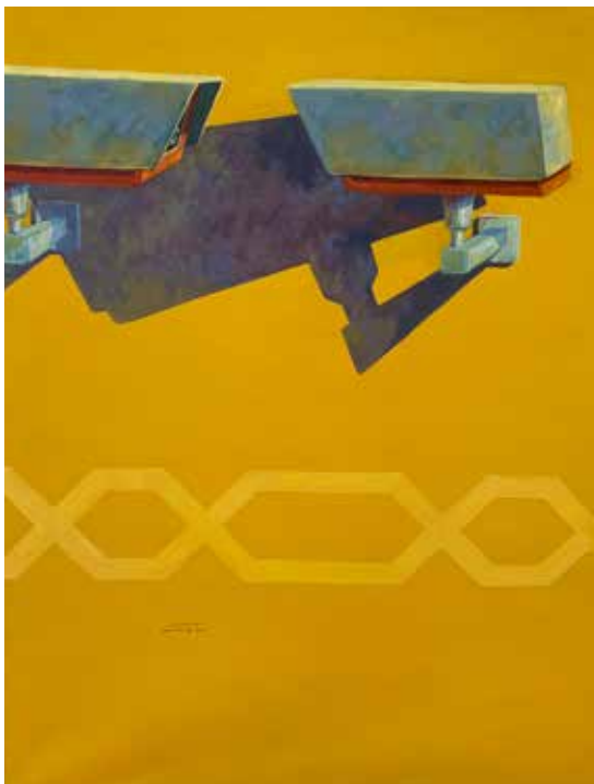
Övervakningskamerorna övervakar varandra

Sist men inte minst är kulturen en viktig bro mellan Palestina och resten av världen. Även om kultur handlar om att få uttrycka sig som man vill, är detta alltid i relation till andra. Att möta den andre är alltid viktigt