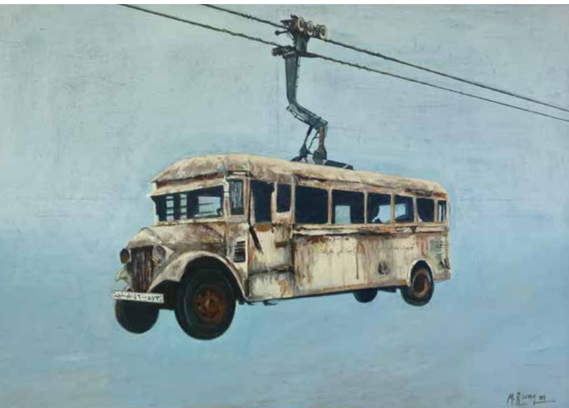
Konstverket Flyktbuss, av en konstnär på Dar al Kalima

när det gäller att förstå sig själv. Det är i ljuset av att möta ett annorlunda sammanhang som man förstår sitt eget unika sammanhang. Kulturen blir sålunda det område där människor kan möta andra och sig själva, där de kan upptäcka ett språk som är glokalt, och där de inser att för att kunna andas måste man hålla fönstren vidöppna för nya vindar och för frisk luft som färdats över hav och oceaner.