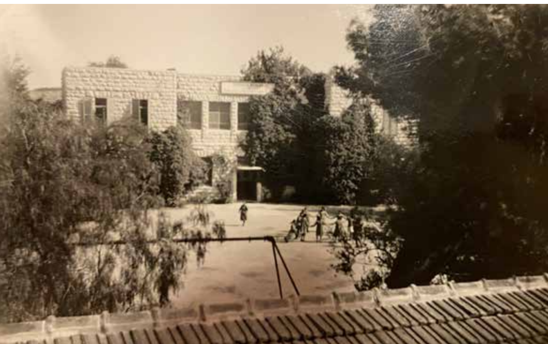
Den svenska skolan 1946.