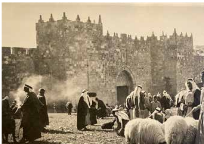
Utanför muren till Gamla stan. Utanför Damaskusporten 1946.