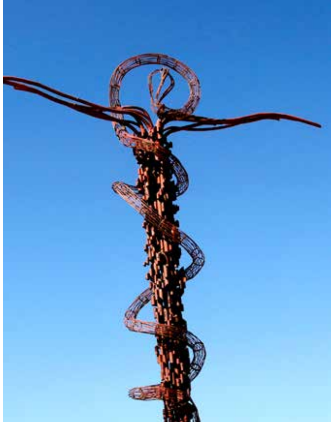
Metallskulpturen som vill påminna betraktaren om kopparormens och människans frälsning genom Jesu korsdöd.