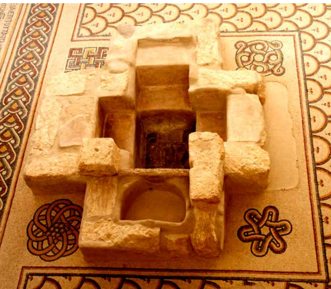
Dopgraven med mosaikgolv.