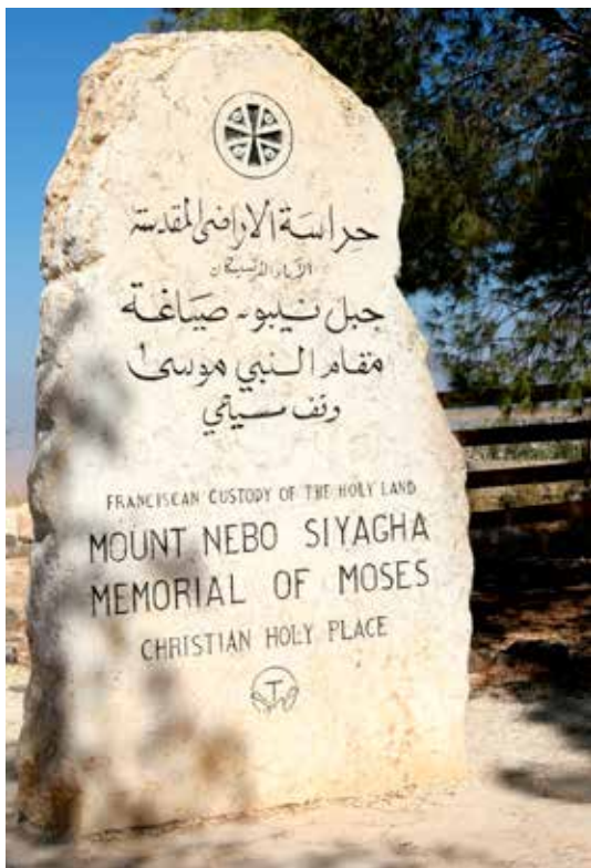
Franciskanerna ansvarar för de viktigaste heliga platserna i Det Heliga Landet och Jordanien.

Munkarna i den tidiga kyrkan berättar om denna upphöjning att det är Mose grav. Visserligen står det i 5 Moseboken 34:6 att ingen människa vet var graven är belägen och ändå fördes berättelsen vidare från generation till generation. I dag är det ingen som vet var graven är belägen.