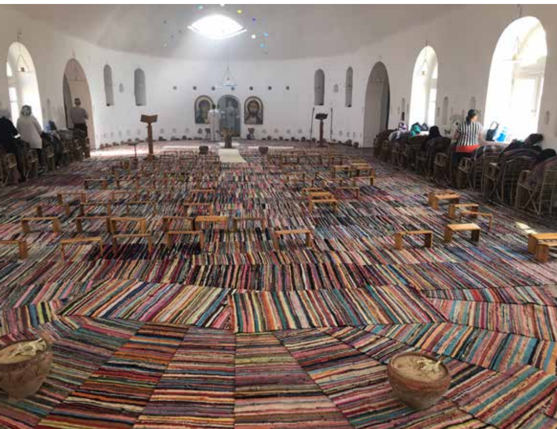
Biskop Thomas' kyrka i klosteranläggningen Anafora är, liksom allt annat på Anafora, täckt av trasmattor.

Vår tro på Kristi uppståndelse innebär att vi bekänner att vi tagit emot Guds frälsningsverk inom oss , och då blir ropet hosianna eller fräls oss uppfyllt.