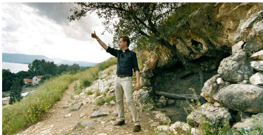
Tunnen upp.

Filmerna finns, tillsammans med annat pedagogiskt material, på Verbum Novum Undervisning som är en digital tjänst som kostar från 79 kr/mån (se: www.verbumnovum.se ).