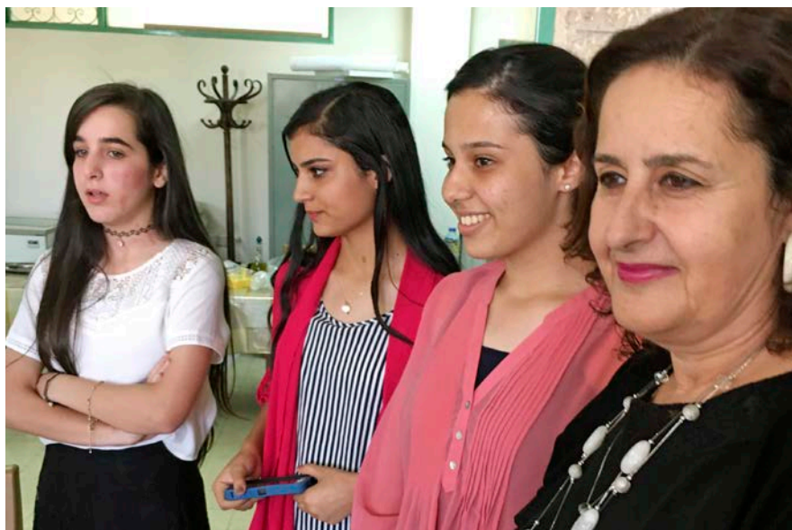
Rektor Aida med tre studenter berättar om skolan för svenska besökare.

skolan mer än att ge eleverna en god skolutbildning. Det är ett fredsarbete som även vi kan dra erfarenheter ifrån och lära av i våra sammanhang. ■