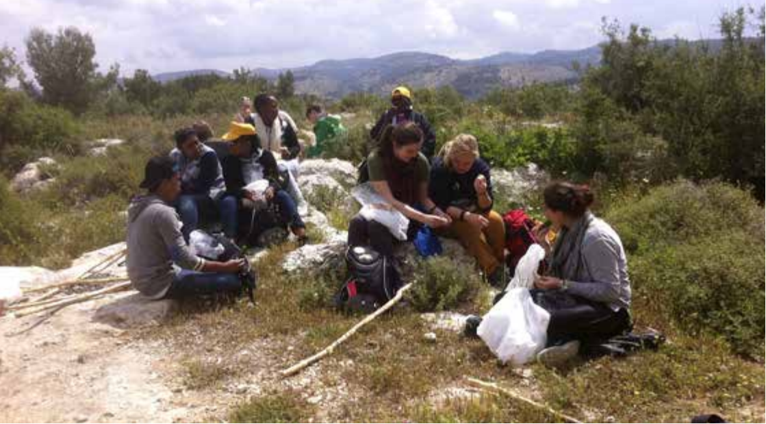
Välbehövlig vila.