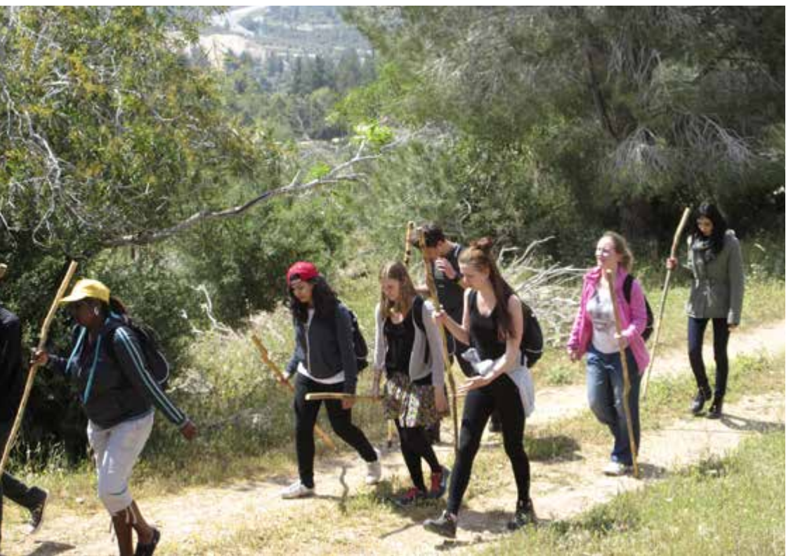
Tyska, sydafrikanska, palestinska och svenska ungdomar vandrar mot Emmaus.

Det sunnitiska Hamas lämnade relationen med Syrien och Hisbollah och därmed även med Iran för att närma sig det Muslimska brödarskapet under president Mursis tid vid makten i Egypten. Förr stod den politiska kampen i Mellanöstern mellan "sekulära" och religiösa partier oftast under någon form av beskydd av/