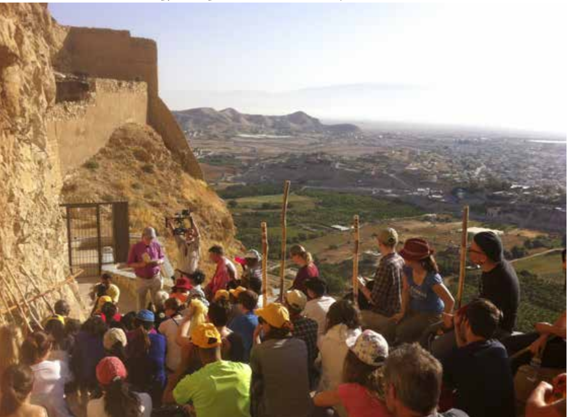
Vid Frestelsernas berg firar ungdomarna mässa med biskop Åke Bonnier.