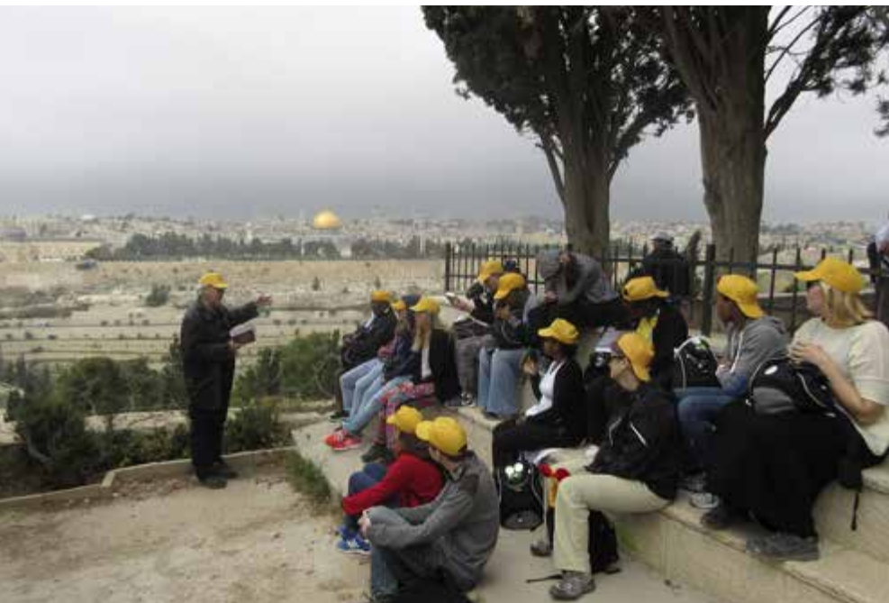
I utkanten av Jerusalem sitter ungdomarna och tittar över Gamla stan Foto: Ulla-Stina Rask.

Vandringen var avslutningen på "Walking to Emmaus" ett projekt som initierats av Skara stift och genomfördes i samverkan med de lutherska kyrkorna i – Det Heliga Landet (ELCJHL), Sydafrika (ELCSA) och Tyskland (ELKB). Vandringen gick ut på att en grupp ungdomar skulle dela tro och liv under två veckor, en i Sverige i augusti 2014 och en vecka i Det Heliga Landet under påsken 2015. Resultatet av projektet är mycket intressant, då det i deltagarnas utvärdering visar unga människors vilja till förändring och ansvarstagande i att verka för en fredlig, hållbar och pluralistisk värld. Acceptans av pluralism och mångfald kan vara en väg mot en fredlig, rättvis och hållbar värld. I det nya Mellanöstern motabeta pluralism och mångfald genom övergrepp och förtryck.