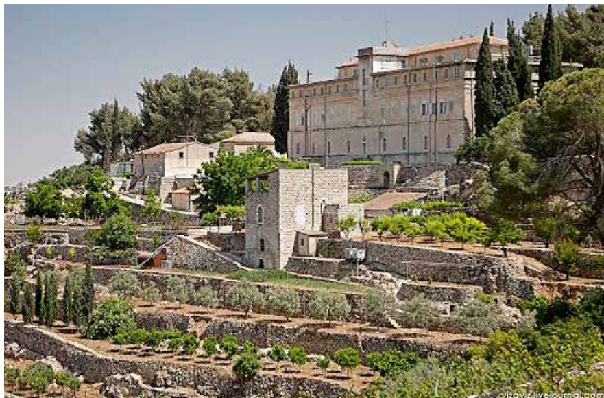
Munkarnas kloster med terrassodlingar: Foto: Stig Norin

Patriarken ville tacka alla dem som, lokalt och internationellt, under årens lopp stött den kristna gemenskapen i det Heliga Landet, inklusive församlingen i Beit Jala, St Yves Society, statssekretariatet, biskopskonferenserna i USA och Europa, konsulerna i Jerusalem, de Salesianska fäderna, de berörda advokaterna och de tre borgmästare i regionen som besökte den Heliga Fadern i Rom en månad tidigare i denna sak.