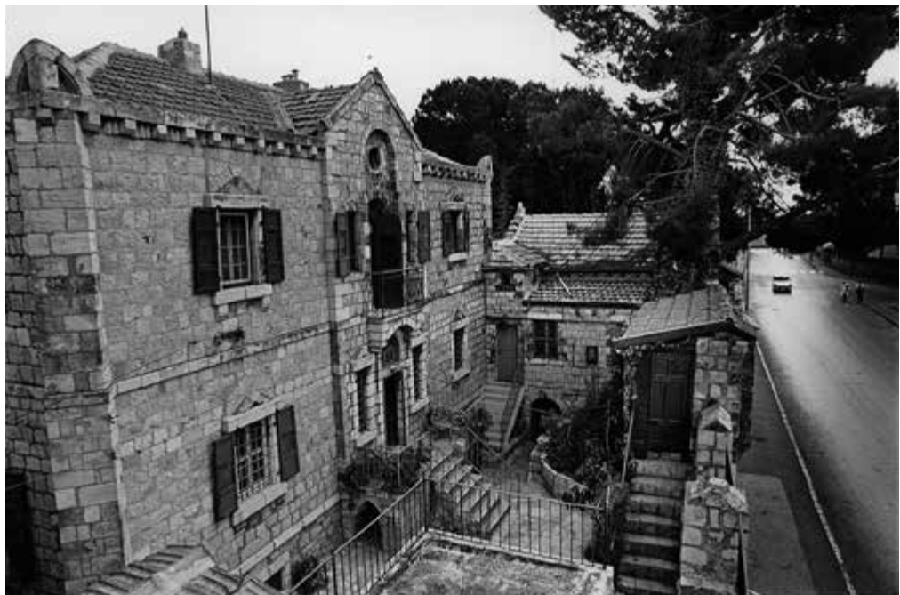
Fastigheten Beit Tavor, huset Tavor på 1960-talet.

Samma sommar blev också etablerandet av "Svenska teologiska institutet" som forsknings- och studieinstitut i Jerusalem godkänt hos det israeliska utbildningsdepartementet. Det var ingen självklarhet att ett kristet institut skulle få tillstånd etablera sig i Jerusalem. Till stöd och hjälp fanns ingen mindre än Martin Buber