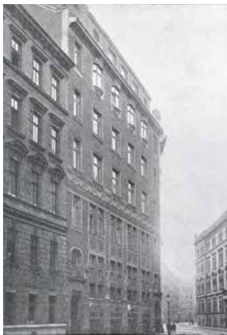
Svenska Israelsmissionens fastighet på Seegasse 16 i Wien.