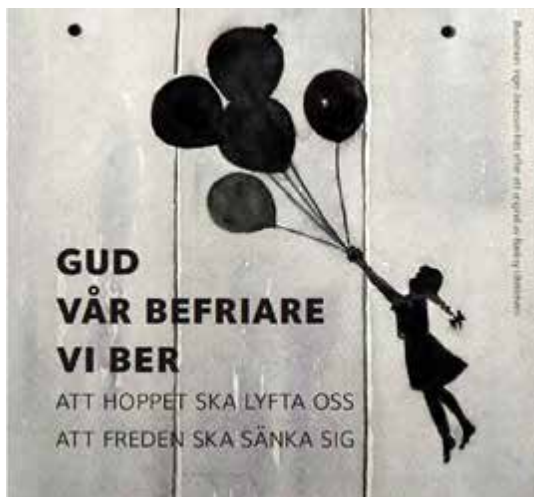
Illustration: Inger Jonasson.

I den här kontexten är en politisk fånge någon som sitter fängslad av skäl som kan sägas vara "ockupationsrelaterade", för att de arbetat mot ockupationen eller för att de av samvetsskäl inte kan vara en del av ockupationsmakten. Bland de politiska fångarna i Israel finns bland annat palestinska parlamentsledamöter, personer som kämpar för mänskliga rättigheter eller arrangerar demonstrationer, minderåriga som anklagas för att ha kastat sten och israeler som vägrar tjänstgöra i armén.