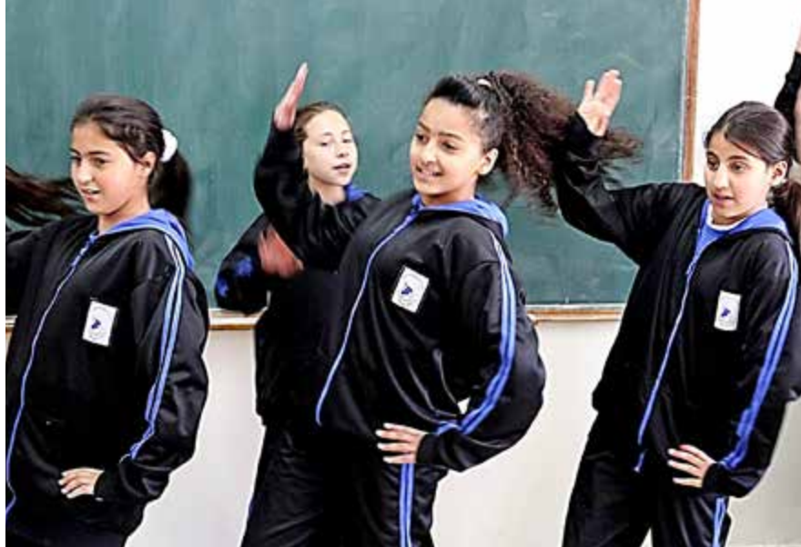
Estetiska ämnen lockar fram lekfullheten – också på Den gode Herdens svenska skola.

Hoppet är det sista som överger människan. Att drömma om en bättre framtid är att hålla hoppet vid liv. Drömmen kan lätt övergå till passivitet, att man inte gör något för det verkar så hopplöst, så långt in i framtiden innan drömmen kan gå i uppfyllelse.