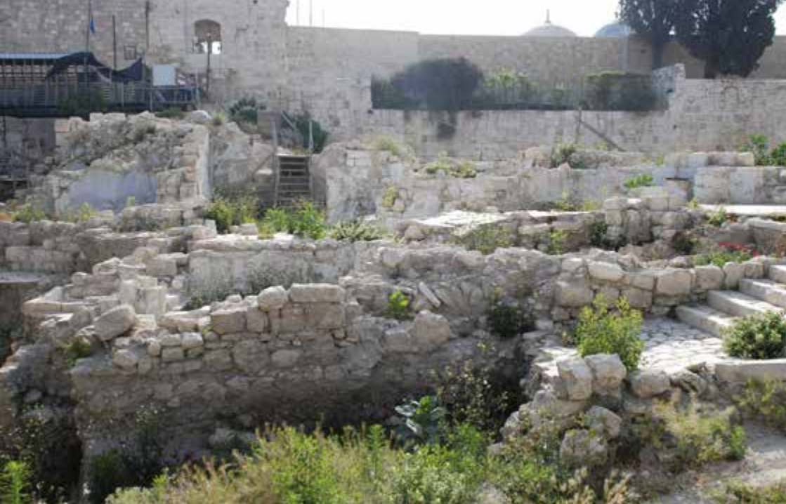
Utgrävningar vid Tempelplatsen.