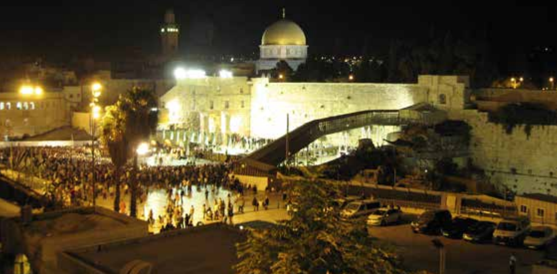
Nattvy över västra muren och tempelplatsen.