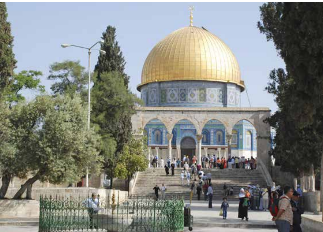
Tusentals bedjande och turister besöker Tempelplatsen varje år.

– När jag besökte Jerusalem 1961 så stod vi på taket till Davids grav på Sions-