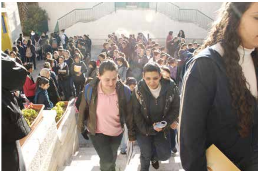
Den gode Herdens svenska skola i Betlehem – ett fredsprojekt.

sina grannars tro och seder. Att judiska, kristna och muslimska ledare samarbetar i CRIHL mot samma mål är ett tecken på hur religion kan bidra till fredsbyggande.