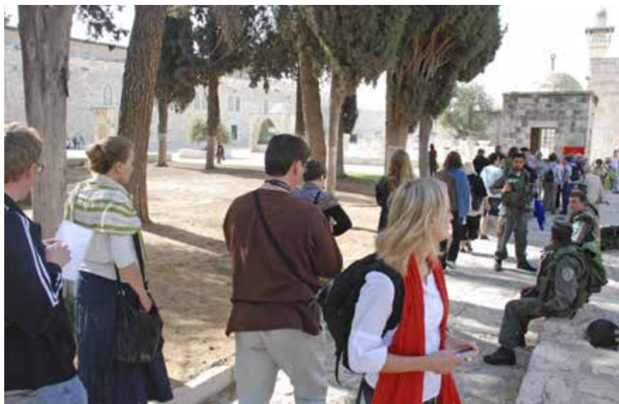
Beväpnade israeliska säkerhetsmän övervakar – också på Tempelplatsen, eller Haram el Sharif, som den heter på arabiska.

– Vi vill bara att judar ska ha rätt att gå upp till Tempelberget och be utan att få stenar kastade på sig. I ett civiliserat land borde alla ha rätt att be var de vill. Den nuvarande status quo behöver förändras genom dialog.