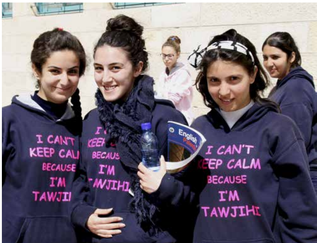
Glada elever i avslutningsklassen.

Ambitionen att lyckas i studenten går inte att ta fel på. På eget initiativ har de unga damerna i avgångsklassen tryckt upp luvjackor med budskapet att de är på väg till