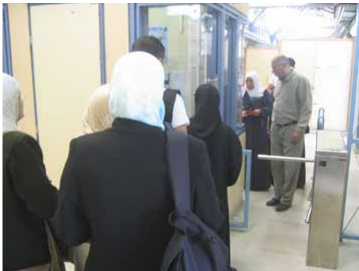
Stängda gränser. Hot. Instängdhet. Förnedring. Bilden från checkpointen mellan Betlehem och Jerusalem.

Idag måste vi återerövra utrymme i den offentliga sfären för rösten från den poli-