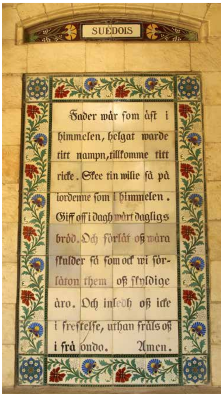
Den äldre svenska översättningen.