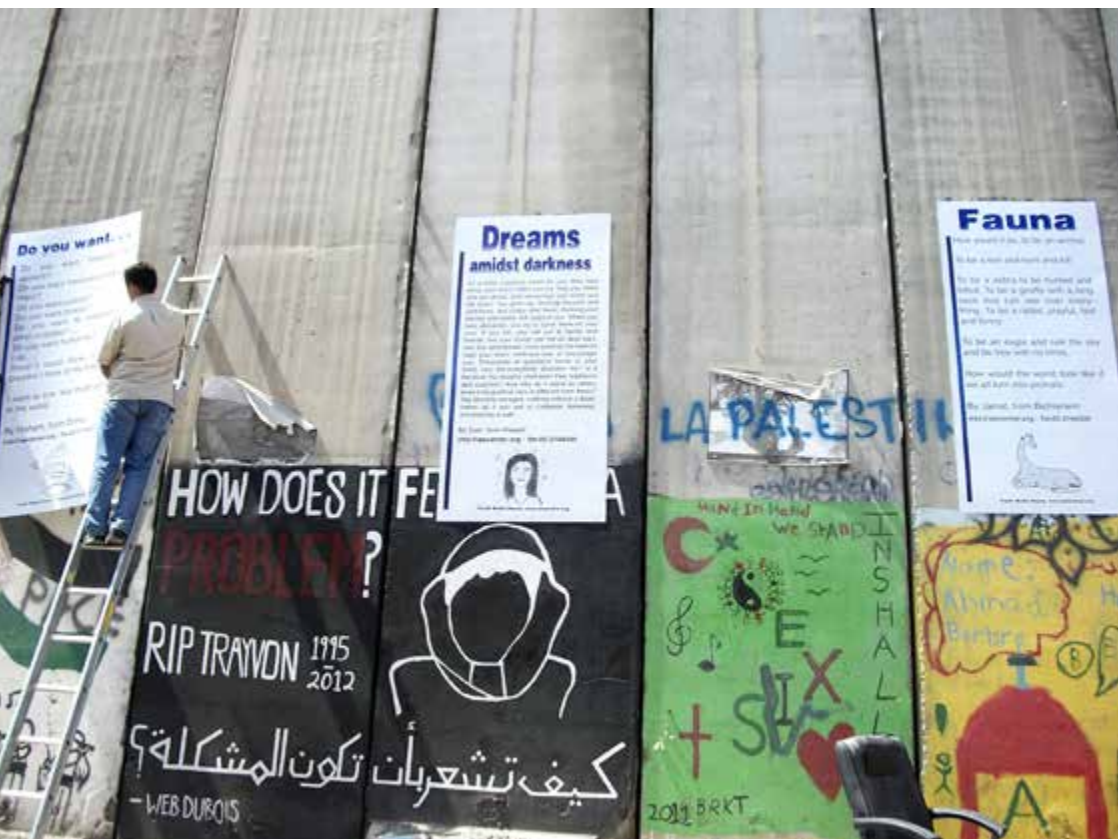
Texter av ungdomar, s.k. "sumud" eller levnadsberättelser, klistras upp på Murruseet i Betlehem. Här är det ungdomarnas drömmar det gäller.

hela hennes kibbutz hade raketbeskjutits i veckor och månader och familjen gått och lagt sig med ytterkläderna på natt efter natt för att snabbt kunna rusa ner i skyddsrummen.