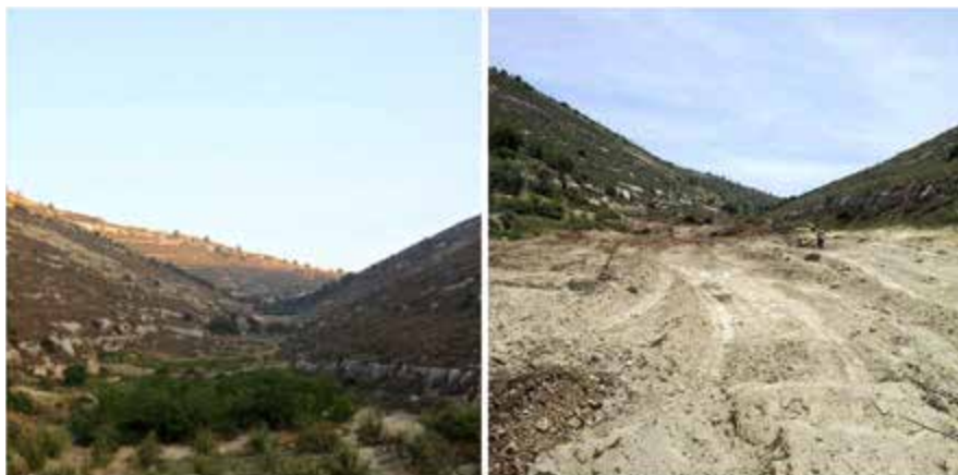
Före och efter israeliska bulldozers förstörde terrassodlingarna.