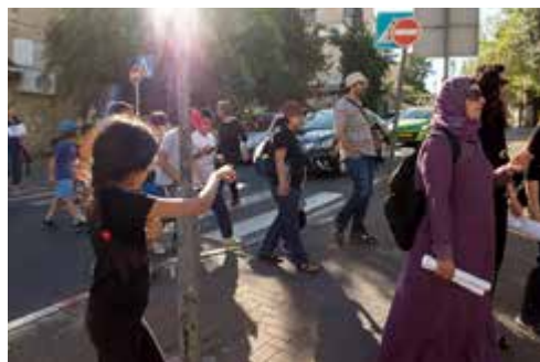
I historiens fotspår. Palestinska och judiska föräldrar på vandring i Qatamon.

Föräldraföreningen var också på en tvåspråkig rundtur i Qatamon, ett kvarter i västra Jerusalem som under det brittiska mandatet var arabiskt, men som under våren 1948 erövrades av israeliska trupper.