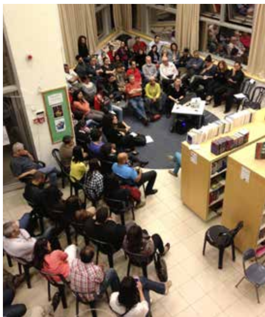
Judiska och palestinska föräldrar i skolbiblioteket lyssnar till personliga berättelser om upplevelser 1948.

Fotnot: För mer information om Hand-i-hand skolorna i Jerusalem och på andra platser i Israel, se http://www.handinhandk12.org/