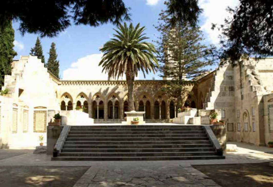
Den vackra kyrkan på Olivberget