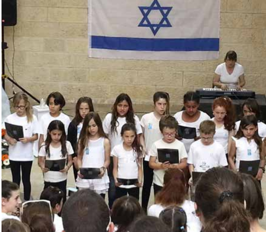
Ceremonin på Israels självständighetsdag.