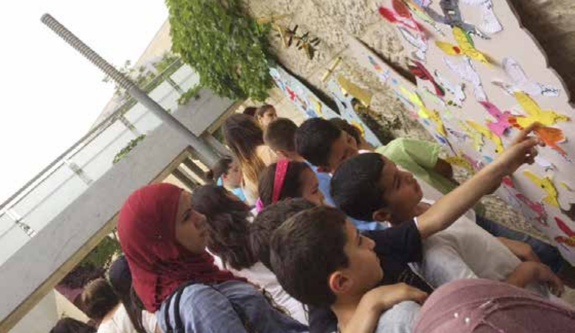
Elevaktivitet på Hand-i-hand skolan på "Minnesdagen för Israels fallna soldater och för terroroffer".

som fallit för att försvara oss, äger rum enligt den hebreiska kalendern, den fjärde och femte i månaden Iyyar. Barnen bär vita skjortor och sirener ljuder under en annars tyst minut. Vi har fyrverkerier, konserter och grillfester i den ljumma försommarskivellen.