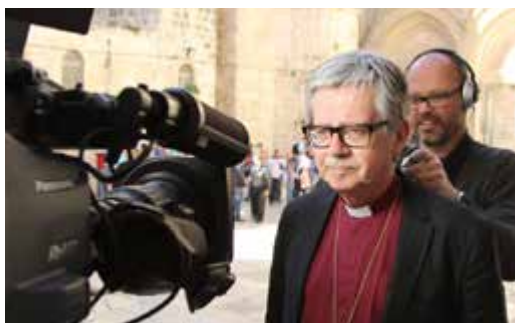
Inspelning framför Gravkyrkan i Jerusalem.