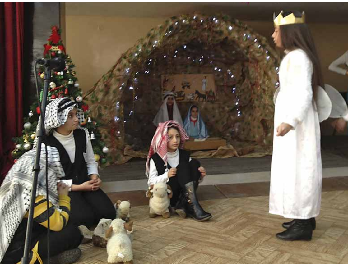
Levande julkrubba med barnen från Den gode Herdens svenska skola i Betlehem.