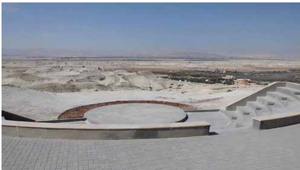
Den lilla amfiteatern med utsikt över Jordandalen. Tänk en stjärnklar kväll här.