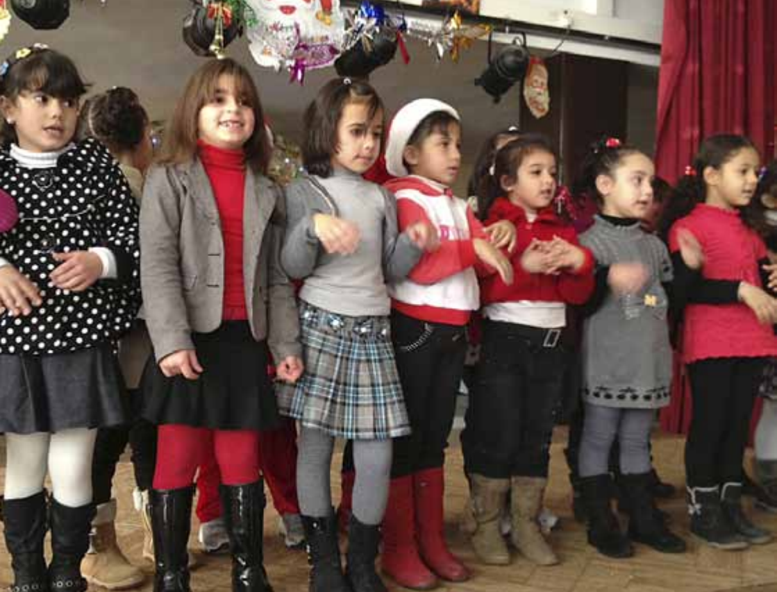
Förskolebarnen deltog i Den gode Herdens skolas julavslutning.

Blåsorkestrarna, där flera hade säckpipeblåsare med i ensemblen, bereder vägen för en kortge med katolske patriarken i spetsen.