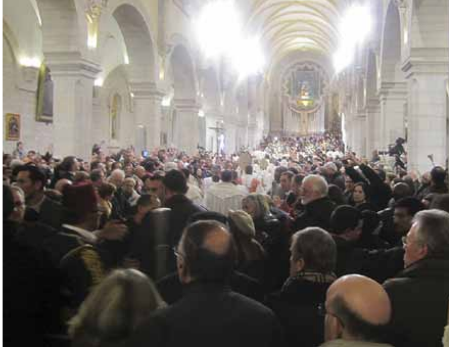
S:ta Katarina kyrka med deltagare från hela världen - en mäktig upplevelse.

Det kändes helt rätt att det var just i Betlehem vi fick se denna vackra julkrubba, som eleverna själva skapat. Vi är kanske inte opartiska, men nog tyckte vi att den Gode herdens skolas julkrubba var ännu finare än julkrubban som byggts av Betlehems stad på Krubbans torg vid Födelsekyrkan inne i centrala Betlehem!