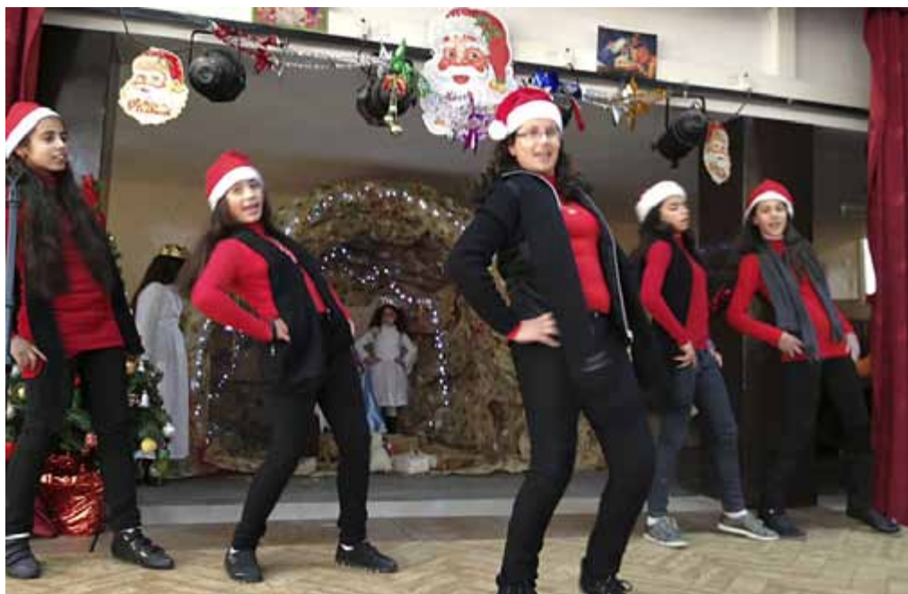
Eleverna på Den Gode herdens skola dansar palestinska folkdansen debke.

Prick kl. 10.15 leddes vi in i den stora aulan – och där på scenen fanns en av de största och finaste julkrubbor vi sett! (Se bild på tidskriftens framsida)!