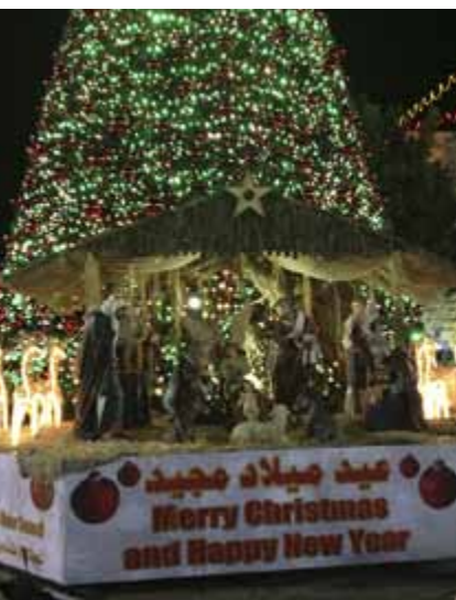
Julgranen på Krubbans torg i Betlehem.

Sitter man i en buss eller bil och åker igenom check-pointen (vägspärren) ser man såklart muren men tänker kanske inte på att dem man möter i Betlehem inte har den möjligheten.