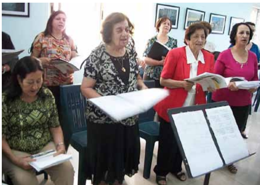
Efter samtalsgruppen på Arabic Educational Institute sjunger kvinnorna i kör.

nare illegala? Visst inte, svarar Bob Lang, det står inte ett ord om bosättningar i Osloavtalet. Hur det kommer att se ut om hundra år är det ingen som vet, men palestinsk majoritet vill han inte ha i Eretz Israel.