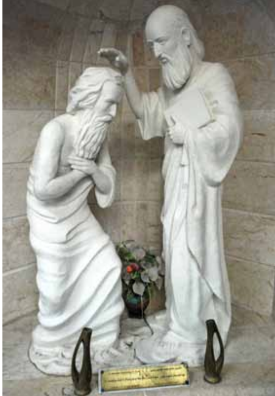
Ananias döper Saulus som blev Paulus. Staty vid Ananias' hus längs Raka gatan i Damaskus.

Skattmästare i Svenska Jerusalemsföreningen och Stiftskonsulent i Skara stift