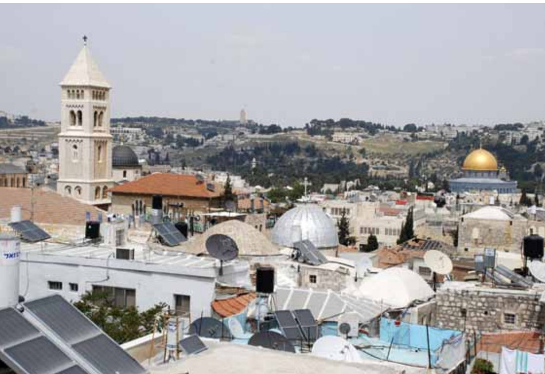
En bön fred mellan människor av olika religioner i Jerusalem.

För att samordna kyrkorna i Palestina och Israels arbete bildades PIEF år 2007 med syfte att kunna driva opinionsbildning för fred, som syftar till en avslutning på ockupationen i enlighet med FN:s resolutioner och för att visa kyrkornas engagemang för interreligiösa handlingar som leder till fred och rättvisa som kan tjäna alla folk i regionen. Kyrkoledarna träffas regelbundet för att stödja och uppmuntra varandra till ett ledarskap som hjälper och uppmuntrar de kristna i regionen att upprätthålla en kristen närvaro i landet där Jesus levde.