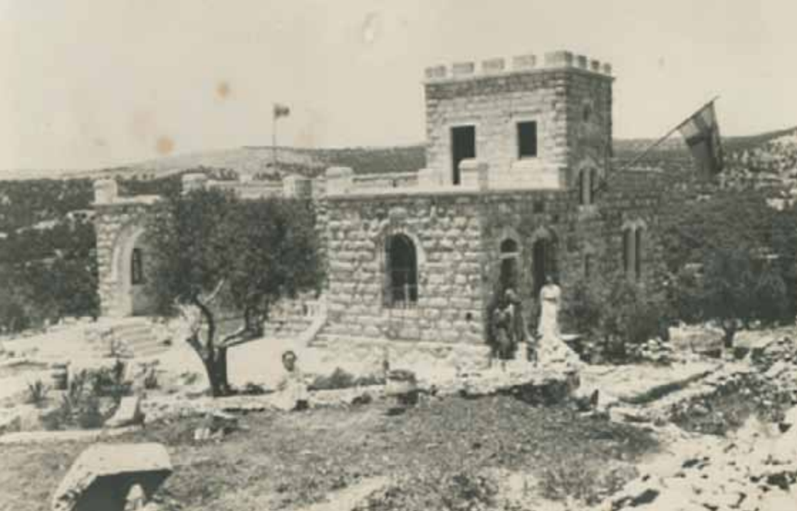
Första huset byggd 1913 – nu administrativ byggnad.

I slutet av 1910 kom ett utarbetat kostnadsförslag till sjukhus från Gustaf för 47 sängar och en cistern. Föreningen hade ännu inte ekonomi därtill.