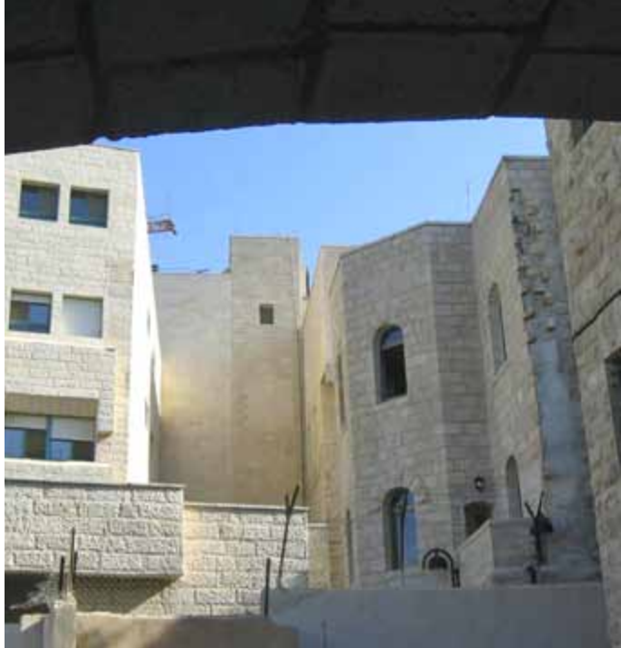
Dagens Betlehemssjukhus är ett komplex i flera våningar. Vy från Den Gode Herdens svenska skola.

familjen börjar planera för att stanna i hemlandet. De flyttar till Halmstad där Gustaf öppnar egen praktik och bygger dem ett eget hus.