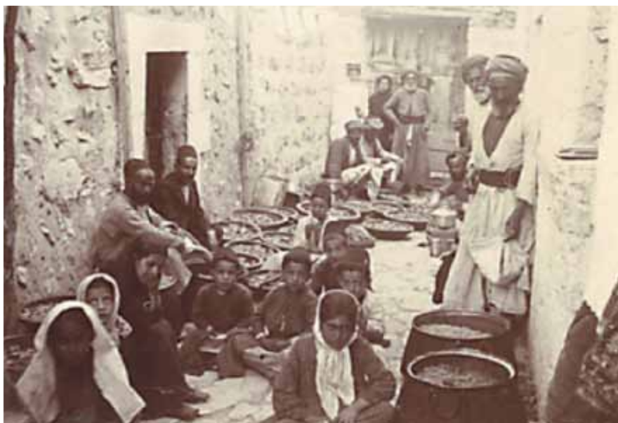
I väntan på sjukvård 1913.

för en läkarbostad och han presenterar förslaget för styrelsen. Så 1907 godkänner styrelsen inköpet av en tomt för att uppföra en bostad åt familjen i Beitjala alldeles intill Betlehems stadsgräns. Därifrån fanns på den tiden en fantastisk öppen utsikt över Beitjadalens olivlundar. Idag finns ingen utsikt kvar, då nya byggnader och muren som Israel har byggt ligger alldeles intill.