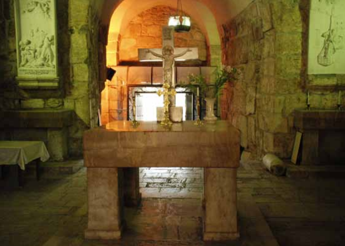
Anrik kristen historia i Syrien; längs Raka gatan i Damaskus ligger detta kapell, ett rum varifrån Paulus flydde i en korg undan förföljarna.

1200 och de europeiska mellan första och andra världskriget. Inte ens under dessa regimer har alla kristna haft full frihet. Därför har de perspektiv på ofrihet, förföljelser och pogromer.