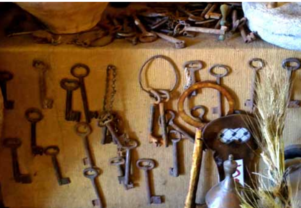
Nyckeln har stort symbolvärde för palestinska flyktingar. Bilden är från "Palestine Heritage Center" i Betlehem.

Grunden för lagen var en fruktan att mängder av palestinska flyktingar skulle vilja återvända till de hem de lämnade år 1948. Många har än idag nyckeln till det