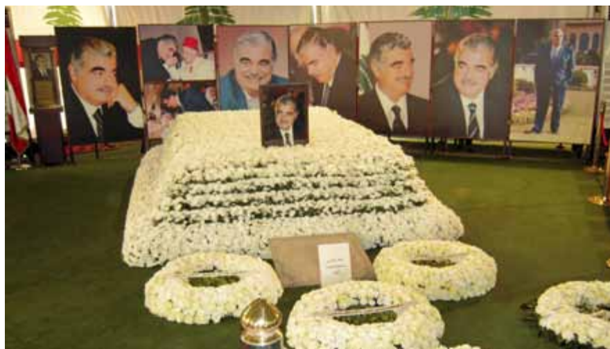
Den 14 februari 2005 mördades den tidigare premiärminister Rafiq Hariri, Libanon i ett bombattentat i Beirut.

Det är viktigt att betona att det inte finns någon kamp mellan muslimer och kristna i Mellanöstern. Det är inte religionsförföljelse av kristna från den muslimska majoriteten som får de kristna att lämna. Däremot förekommer det övergrepp, våld och förtryck av kristna på olika platser av personer eller grupper som är muslimer. Ofta börjar en konflikt av ekonomiska eller andra skäl och övergår i övergrepp på personens eller gruppens religiösa symbol - kyrka, moské. Därför att det har effekt. De fanatiska grupperna är en minoritet men det är tyvärr lätt till mobb-tendenser i samhällen med svag rättssäkerhet och det är lätt att få fram hotfulla situationer. Därför lever många minoriteter idag i en stor osäkerhet i Mellanöstern och det gäller i stor utsträckning kristna enskilda och grupper. ■