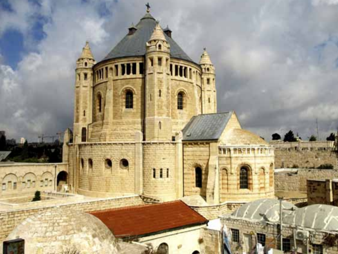
Sionskyrkan ligger majestätiskt och synlig över stora delar av Jerusalem.

hand om Maria, Jesu mor, i sitt hem på Sionsberget. En rivaliserande tradition talar om att samma sak skedde i Efesos. Vad som är historiskt korrekt kan vi idag inte veta, men enligt Jerusalemstraditionen utgör denna grunden för att apostlarna var närvarande på Sion när Maria dog. Enligt denna tradition förenades nämligen alla apostlarna i Jerusalem för att vara med Maria på hennes dödsbädd, med undantag av Jakob, som redan lidit martyrdöden, och Tomas, som befann sig i Indien. Enligt en tradition etablerad på 400-talet var det en vacker och ljus eftermiddag som de slöt hennes ögon och la hennes kropp i en grav. Några dagar senare då Tomas, som inte hunnit fram i tid, ville se hennes kropp, fann de graven tom samtidigt som de hörde himmelska sånger. Till minne av denna händelse har kyrkan sex altare, ett altare för varje av de två apostlarna som Jesus sände ut två och två för att missionera (Mark 6:7). Altarna är donationer från katoliker runt om i världen, så är till exempel Tomas och Andreas altare donerat av katolska kyrkan i Brasilien och Petrus och Paulus altare är donerat av katoliker från Venezuela. Någon Judasanknytning finns naturligtvis inte utan Paulus har fått bilda par med Petrus.