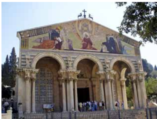
Alla nationers kyrka, färdigställdes 1924 och ligger i Getsemaneträdgården.