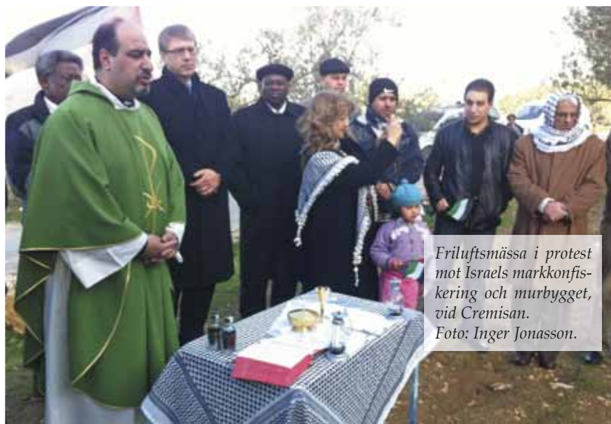
Friluftsmässa i protest mot Israels markkonfiskering och murbygget, vid Cremisan.