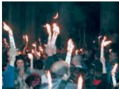
På påsknatten tänds påskljuset i Uppståndelsekyrkan i Gamla stan i Jerusalem och ljuset sprids som en riktig löpeld bland besökare ut på gården