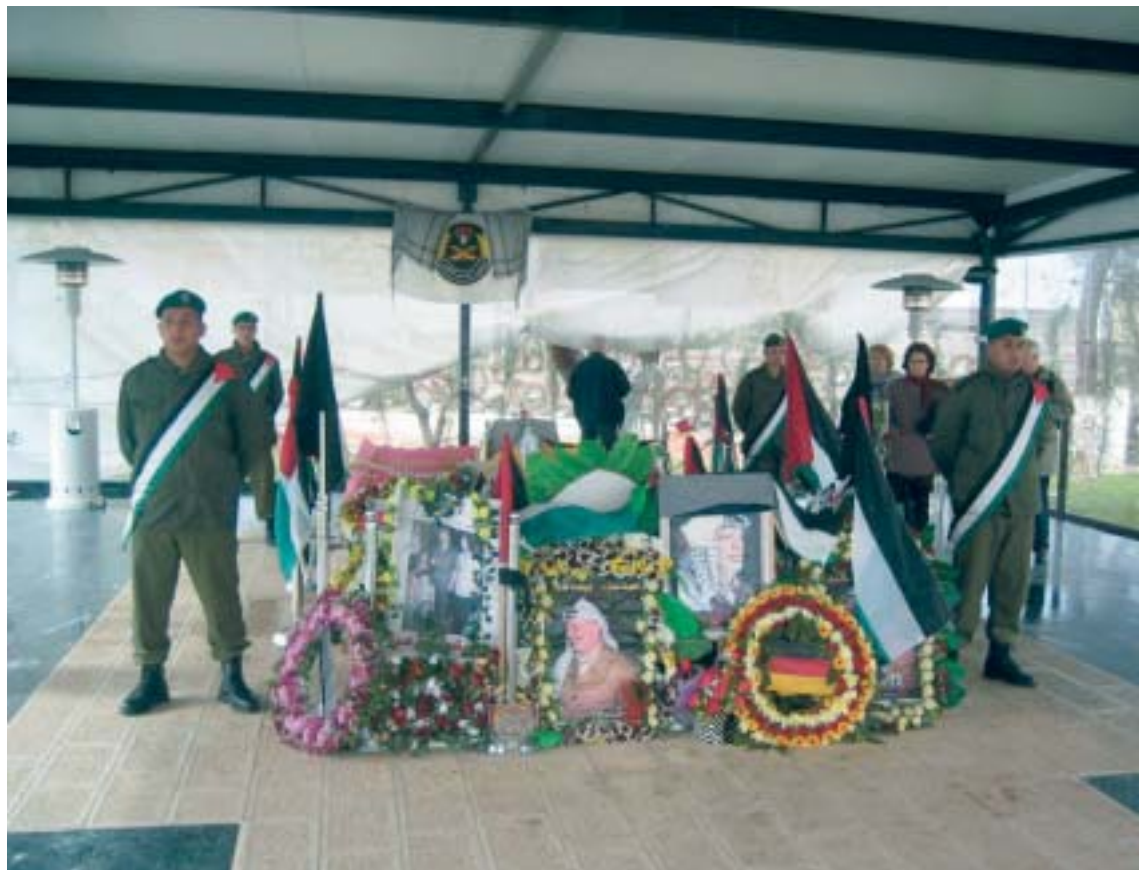
I Ramallah, på den sönderskjutna palatsgården, vilar stoftet av den förste palestinske presidenten Yassir Arafat.