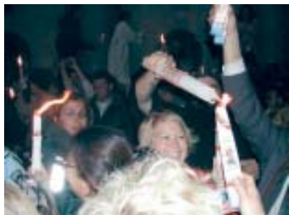
Glädje, förväntan, spänning – alla som samlats vid Uppståndelsekyrkan ska tändas sitt ljus.