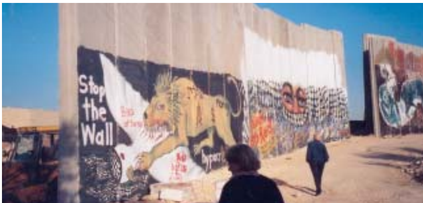
De olika städerna och byarna i Palestina är avskurna från varandra genom murar och stängsel, som här den nya muren runt Betlehem, inte långt från Den Gode Herdens svenska skola.

I den israeliska tidningen Haaretz stod den 21 januari om den israeliska regeringens senaste konfiskering av mark i Östra Jerusalem. Ägarna till marken är kända, men de har Västbanks id-kort och får inte för de israeliska myndigheterna bosätta sig i Jerusalem. Alltså konfiskerar israelerna marken utan kompensation enligt lagen om att man inte har rätt till sin mark om man är frånvarande från den. Men ägarna får inte tillstånd att besöka den eller bo där.