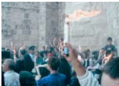
Den heliga elden, symbolen för Jesu uppståndelse, sprids snabbt genom folkmassorna som är församlad i Gamla San i Jerusalem vid Uppståndelsekyrkan.