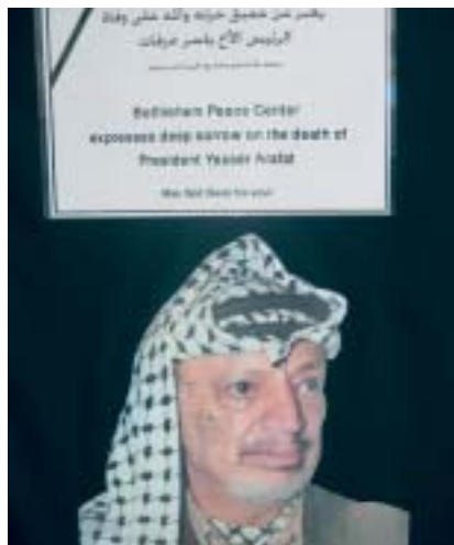
Veckorna efter Arafats död hängde hans porträtt runt om i Palestina, här på Betlehems fredscenter.

Men det går inte att tro att därför att Arafat inte längre finns kommer allt att bli