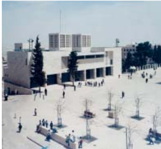
Ett helt nytt torg, ett stort kulturhus framför ingången till Födelsekyrkan – det var Sveriges bidrag till att snygga upp Betlehem inför millennieskiftet. Och nu är torget och kulturhuset återställt efter den israeliska arméns vandalisering.