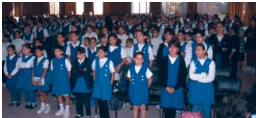
Flickorna vid Den Gode Herdens Svenska skola övar sånger inför julavslutningen i aulan.