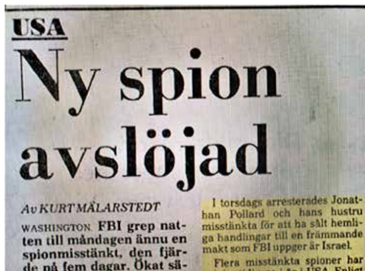
Jay var Jonathan Pollards smeknamn

Jag börjar väl med att googla på "Jonathan Pollard" tänkte jag. Kanske får jag då något napp som jag kan gå vidare med. Till min enorma förvåning fick jag över 85 000 träffar på Jay! Förvåningen övergick i en chock när jag fattade att min gamla kompis Jay var den storspion avslöjades av FBI och som greps den 20 nov 1985 utanför den israeliska ambassaden i Washington!