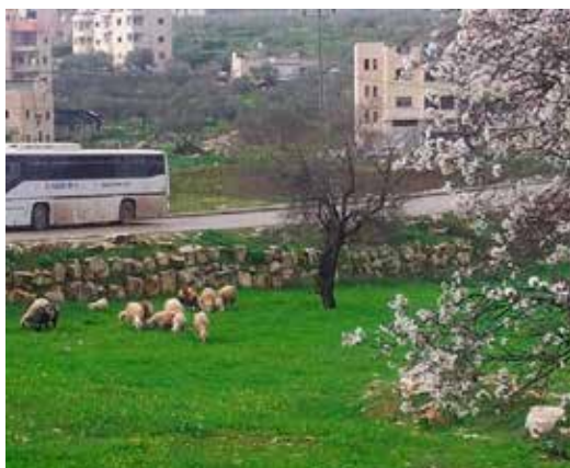
Mandelträd i blomning.