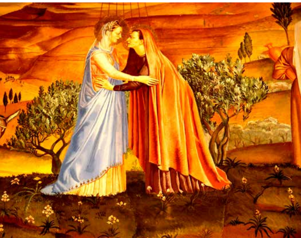
Fresk i nedre kyrkan Maria och Elisabets möte.

trädgården finns sedan några år en flera meter hög staty av Sakarias i full översteprästerlig skrud. Anskrämlig, menar en del, pedagogisk menar andra. Vad man än anser är hela området beskyddat av Custody of the Holy Land och helgat till Guds moder Maria och hennes kusin Elisabet. Helgat till minnet av två kvinnors möte på en gårdsplan, till minnet av att "stora ting låter den Mäktig ske ... hans namn är heligt" (Luk 1:49). ■