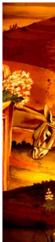
Sakarias som överstepräst.

I och med den kände italienske arkitekten Antonio Barluzzi slutfördes bygandet och kyrkan kunde invigas år 1955. När pilgrimen träder in genom porten till klosterområdet blir hon välsignad av Sakarias som står staty över ingången tillsammans med Elisabet.