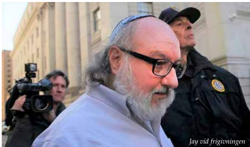
Jay vid frigivningen