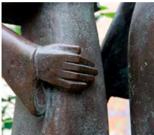
Marias hand på magen

trädgården finns sedan några år en flera meter hög staty av Sakarias i full översteprästerlig skrud. Anskrämlig, menar en del, pedagogisk menar andra. Vad man än anser är hela området beskyddat av Custody of the Holy Land och helgat till Guds moder Maria och hennes kusin Elisabet. Helgat till minnet av två kvinnors möte på en gårdsplan, till minnet av att "stora ting låter den Mäktig ske ... hans namn är heligt" (Luk 1:49). ■