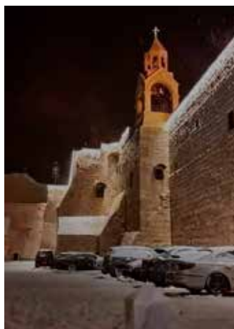
Snö i Betlehem.