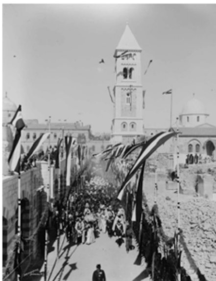
Den tyska kyrkan i Jerusalem invigdes år 1898