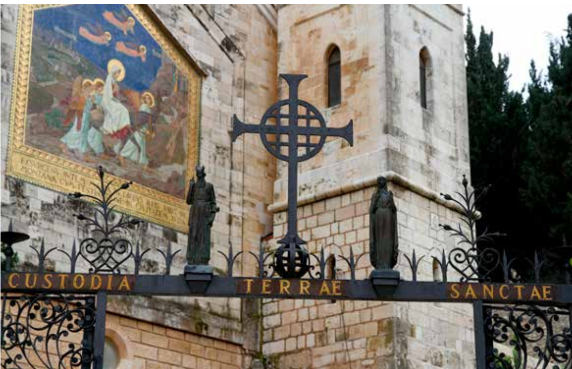
Porten med mosaiken.

till 1600-talet, då franciskanerna tog över, fungerade kyrkan som församlingskyrka och pilgrimskyrka med ett litet kloster. När franciskanerna tog över påbörjades en restaurering och en utbyggnad. Återinvigning skedde år 1674. Ännu i dag pågår en successiv restaurering av murar, konservering av konst och installation av nya konstverk.