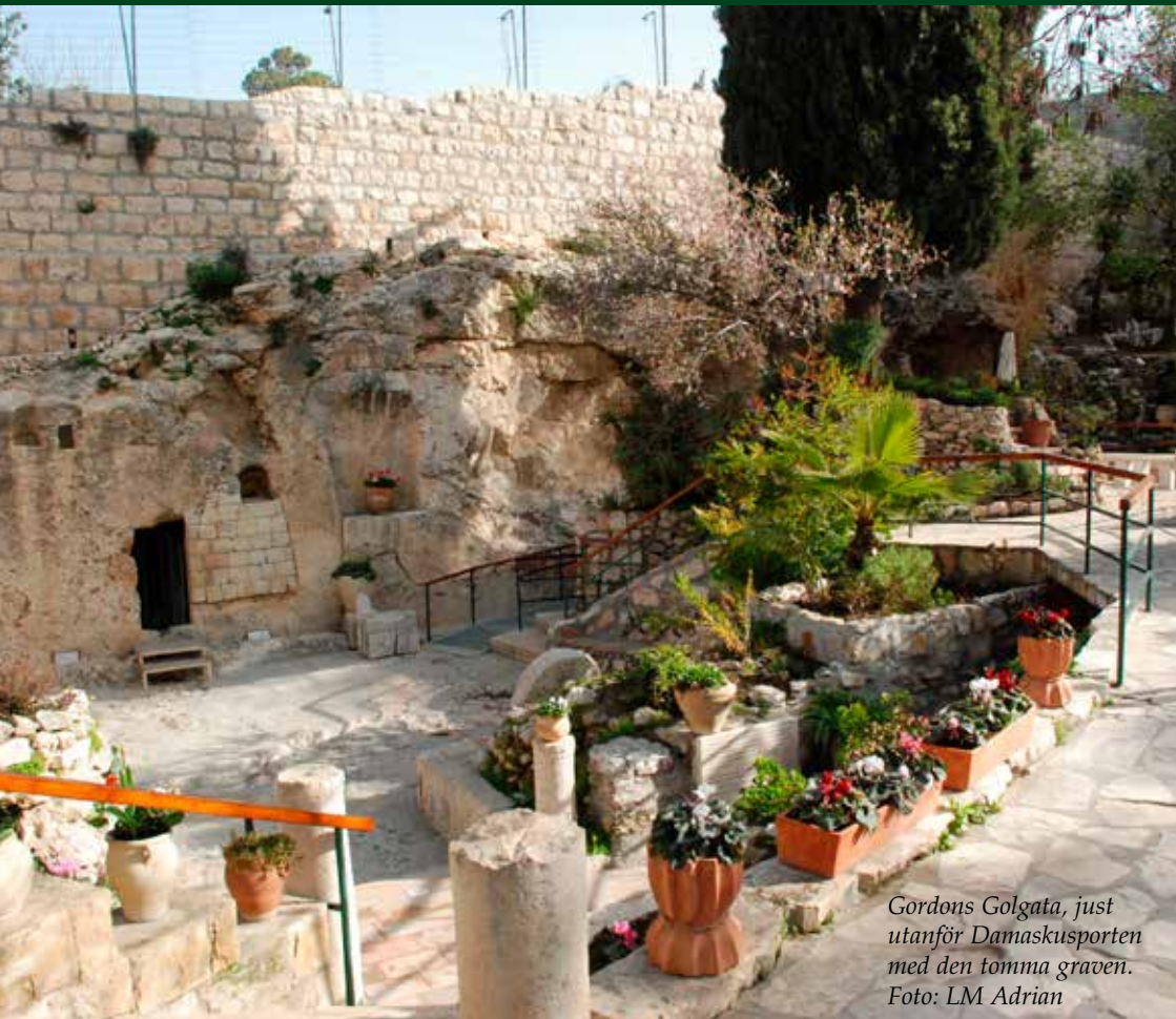
Gordons Golgata, just utanför Damaskusporten med den tomma graven.