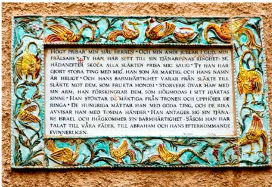
Magnificat på svenska i Johannes döparens kyrka.