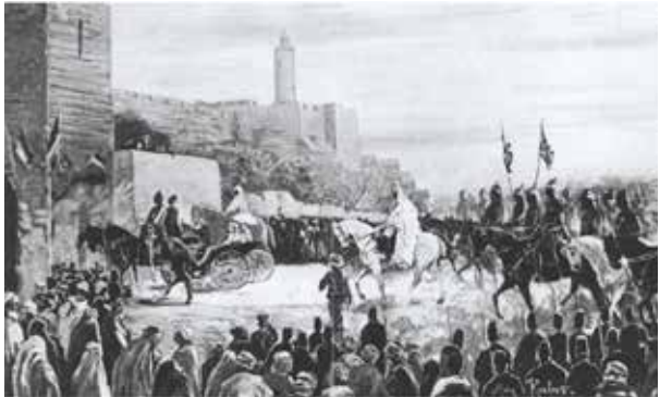
Den tyska kejsaren anländer till Jerusalem.

Den 29 oktober klockan 15 kom den kejsarliga kortegen, med kejsaren själv ridande på en vit häst fram till den nybyggda kyrkan. Kejsaren hälsades av den preussiska kulturministern och svarade själv med ett tal, som enligt von Schéeles referat gick ut på att evangeliets bekännare, det vill säga de närvarande gästerna, skulle uppföra sig väl i staden, så att trons sanning blev genom deras vandel bekräftad. Men undrar ju litet vad han befärade.