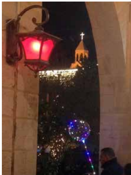
Julstämning i Betlehem.

Liksom förra året med pandemin så kommer också detta års julfirande att bli begränsat och nedtonat. Få turister och pilgrimer besöker Betlehem och många hotell och restauranger har ännu inte hämtat sig från nedstängningen under Covid-19-pandemin. Den nyrenoverade Födelsekyrkan kan troligen besökas utan att man som vanligt behöver vänta i köer för att se grottan under högaltaret. Trots att kristna är trängda av den ekonomiska situationen nästan utan inkomster från turismen, så upplevs nog det politiska läget tyngre – med utökade bosättningar och repression.