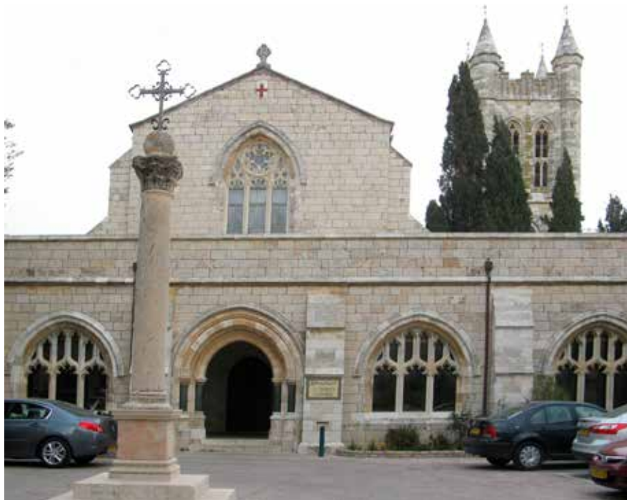
Den anglikanska St George katedralen, norr om gamla staden.