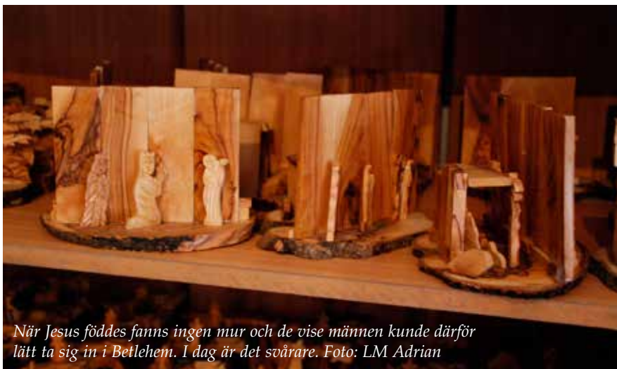
När Jesus föddes fanns ingen mur och de vise männen kunde därför lätt ta sig in i Betlehem. I dag är det svårare.

I dag fortsätter den tysta annekteringen av land bland annat i Cremisan- och Makhrou-områdena som har gamla vackra terrasserade vingårdar. Den norra infarten till Betlehem kring Rakels grav som förr var ett av de livligaste affärsområdena, gör sedan det annekterats för byggande av en judisk bosättning skäl för psalmens ord: "O Betlehem du lilla stad hur tyst du ligger där..."