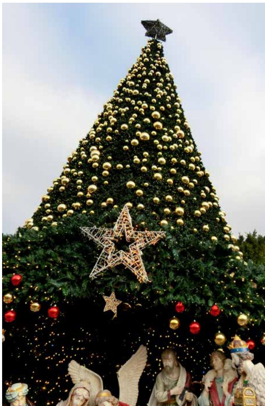
Den stora julgranen på Krubbans torg.