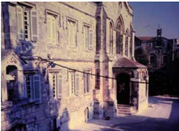
Christ Church, Jerusalems äldsta protestantiska kyrka.